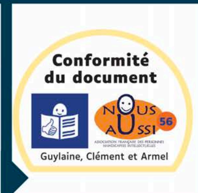
validation FALC Facile À Lire et à Comprendre