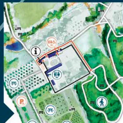
passage à l'aquarelle