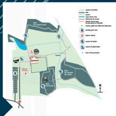
conception d'un plan d'étude